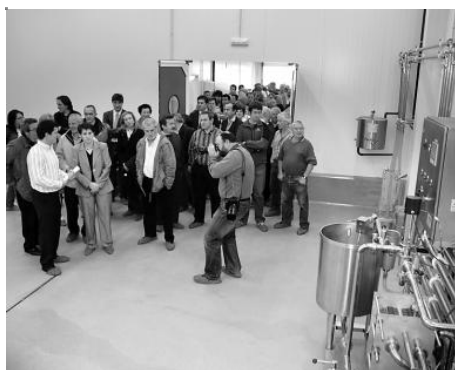
Autoridades, socios e invitados inauguraron la quesería.

ARIZKUN. El queso Baztangoa, una marca registrada por Baztandarra Sociedad Cooperativa que integra a la práctica totalidad de los ganaderos y pastores del Valle de Baztan, se presentó ayer en sociedad con carácter oficial, después de cumplir dos meses en el mercado donde está obteniendo una excelente acogida. La entidad recoge 650.000 litros de leche de oveja de raza lacha en los diez meses de campaña, que quiere dedicar progresivamente hasta su totalidad a la fabricación quesera.